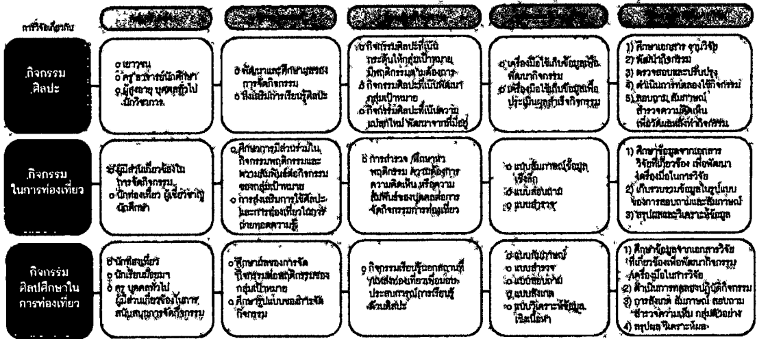
ภาพประกอบ 8 ความสัมพันธ์ของงานวิจัย