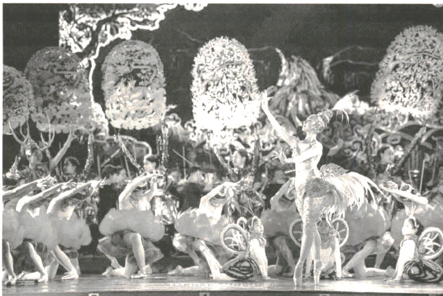
ภาพ: การแสดงชุดบัลเลต์มโนโหรา ในงานพระราชพิธีมหามงคลเฉลิมพระชนมพรรษา 70 พรรษา สมเด็จพระนางเจ้าสิริกิติ์ พระบรมราชินีนาถ พระบรมราชชนนีพันปีหลวง