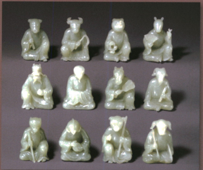
ถ้วยทองคำตุ่นลายสิบสองนักษัตร พบที่เขตปกครองตนเอง ซินเจียง ศิลปะจีน พุทธศตวรรษที่ ๑๒-๑๔ ที่มา : พิพิธภัณฑ์เมโทรโพลิแทน สหรัฐอเมริกา ๒๔