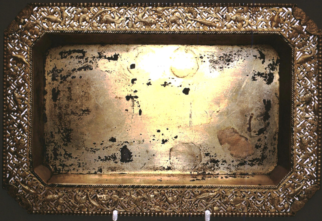
ภาตทองเหลือง ศิลปะจีน ราชวงศ์ซิง พุทธศตวรรษที่ ๒๔-๒๕

กลายเป็นมังกร แสดงถึงความอดสาหะและอวยพรให้มียศศักดิ์ในเร็ววัน ๓๒ ส่วนลายปลาทอง ว่ายน้ำท่ามกลางสาหร่ายและไม้น้ำมีความหมายว่า ทองและหยกเต็มบ้าน ๓๓ ส่วนเห็นดลนิจือ บนหิน มาจากความเชื่อที่ว่า มีสรรพคุณทางยารักษาโรคได้ จึงหมายถึงความมีอายุยืน ซึ่งลวดลาย มงคลเหล่านี้ตั้งอยู่พื้นหลังลายสวัสดิกะที่ต่อเนื่องกันไปไม่มีต้นและปลาย ซึ่งมีความหมายตรงกับ คำว่า หมื่น หมายถึงทุกเรื่องมากมายเหลือคณานับ ๓๔ นับเป็นความชาญฉลาดของช่างผู้ผูก ซึ่งทั้งหมดนี้เป็นการอวยพรให้มีโชค ลาก อายุยืน และสมปรารถนาตลอดไปนั่นเอง นอกจากนี้ลาย สวัสดิกะต่อเนื่องกันไปโดยรอบภาตแล้ว ตรงกลางกันภาตมีตราประทับคู่หนึ่งประกอบด้วย ตราอักษรไทย “โลงวน” กับตราอักษรจีน 泰原 อ่านว่า ไท่หยวน ๓๕ ตามสำเนียงจีนกลาง ผลิตภัณฑ์ทองเหลืองของห้างนี้ ผลิตโดยช่างจีนในไทยและจำหน่ายในตลาดไทยเท่านั้น