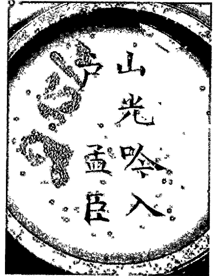
ปั้นหู ทรงลูกแก้ว สีสวาด ปากเหลี่ยมทอง ศิลปะจีน สมัยราชวงศ์ชิง (พ.ศ. ๒๑๘๗-๒๔๕๔)