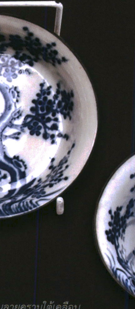
เคลือบครามใต้เคลือบ