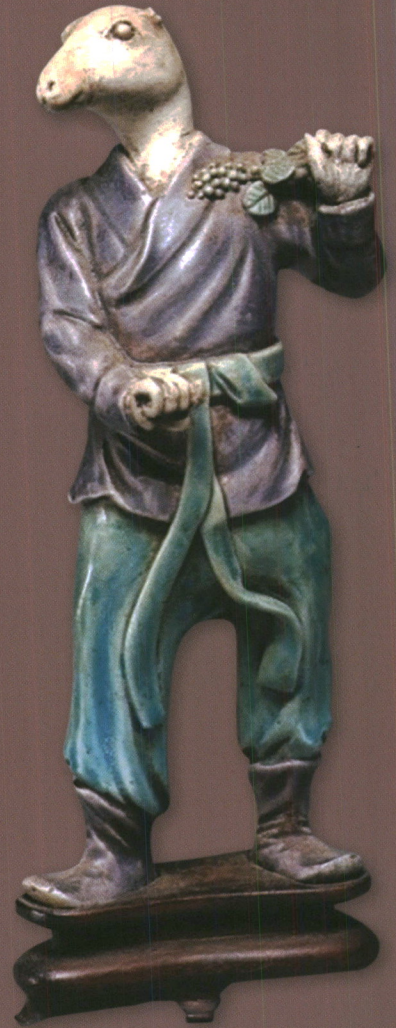
นักษัตรปีชวด รูปคนครึ่งกระรอกถือพวงองุ่น ศิลปะจีน สมัยราชวงศ์ชิง (พ.ศ. ๒๑๘๗-๒๔๕๔) ๓๒

ความหมายของลวดลายค้ำคาวที่มุมทั้งสี่ของลาดหมายถึง โชคลาก เพราะคำว่า ฝู เป็นคำพ้องเสียงระหว่างค้ำคาวกับคำว่าโชคลากในภาษาจีน ๓๐ ถัดมาเป็นภาพนกเกาะกิ่งไม้ หมายถึง ความสุขสดชื่น ส่วนภาพสัตว์น้ำท่ามกลางสาหร่ายและไม้น้ำ มีทั้งปลาหลี ปลาทองและกึ่ง กำลังแหวกว่ายท่ามกลางคลื่นน้ำ สาหร่าย และไม้น้ำ ประกอบไปด้วยความหมายมงคลหลายอย่างกล่าวคือ กึ่งมีลำตัวงอทำให้สามารถติดตัวไปได้ไกล มีแต่ความสมหวัง ไม่มีอุปสรรคใด ๆ มาขวางกั้น ๓๑ ถัดมาคือปลาหลี ซึ่งพ้องเสียงกับคำว่ากำไร และยังมีความเชื่อที่ว่า ปลาหลีกระโดดข้ามประตูสวรรค์