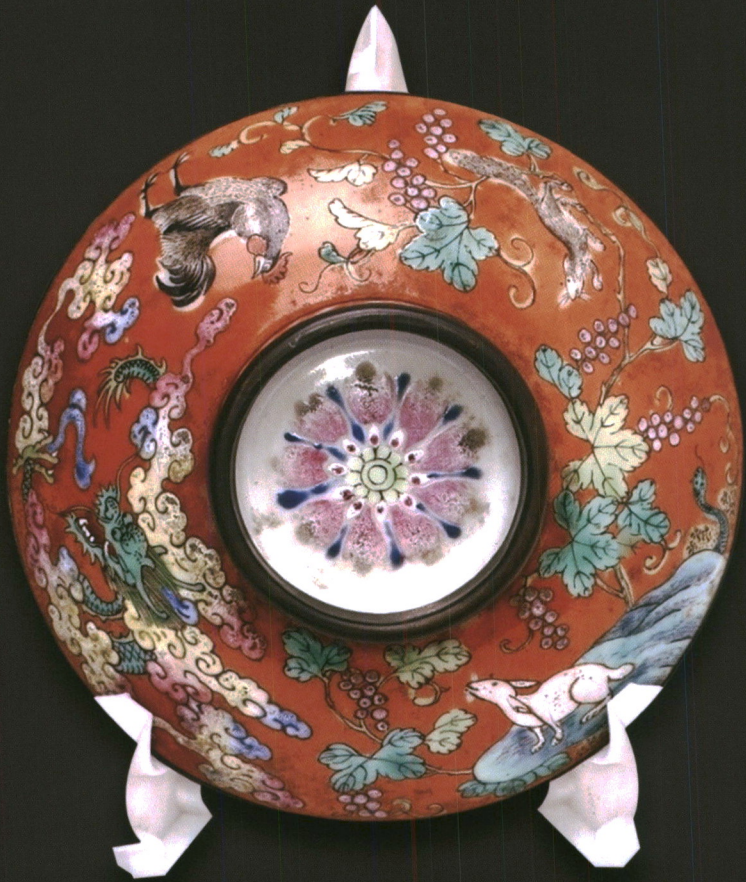
ภาพลัทธิสัญลักษณ์ ลึบสองนักษัตร บนหลังฝาด้วยซง

สำหรับชุดน้ำชาจีน เป็นที่ชาแบบสยามที่เรียกว่า ชุดจีน ๒๐ ในหนึ่งชุดประกอบด้วยปั้นหู ถ้วยซงขนาดใหญ่มีฝา อ่างรอง ถ้วยตวงสี่ใบ และถาดรอง ลักษณะภายในเขียนลายครามได้เคลื่อน เป็นไม้มงคลประกอบกับบนกขนาดเล็กตามรูปแบบของลวดลายนกเกาะกิ่งบัว ส่วนด้านนอก เขียนหลายสีเหนือเคลือบเป็นรูปสัตว์ต่าง ๆ ประกอบด้วยกระรอก กระบือ เสือ กระต่าย มังกร งู ม้า แพะ ลิง ไก่ สุนัข และสุกร บ้างเดิน บ้างเหาะ ท่ามกลางถ่างุ่น พรรณไม้ เมฆหมอก และก้อนหิน ซึ่งเป็นสัญลักษณ์ประจำลึบสองช่วยยามในหนึ่งวัน ๒๑ และในแต่ละปีจนครบรอบ ลึบสองปีตามคติความเชื่อของจีน