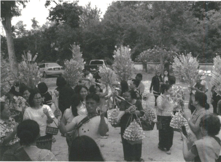
ภาพ 6 ขบวนแห่ผ้าป่าบุญสงกรานต์ปี 2561 ชาวบ้านสามารถรวบรวมปัจจัยได้มากถึง 800,000 บาท