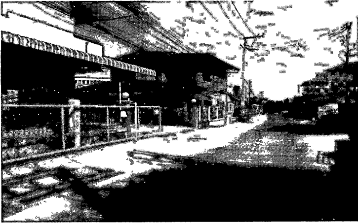
ภาพ 1 บางส่วนของสภาพชุมชนบ้านศรีโคโคอกในปัจจุบัน

อะพาร์ตเมนต์ 4 ร้านค้า ร้านบริการ และกิจการเกี่ยวเนื่องอีกมากมายเพื่อรองรับความต้องการของนักศึกษา เช่น ร้านอาหาร ร้านซักรีด ร้านทำผม อยู่ช่อมรดก ร้านเช่า เป็นต้น ชาวบ้านส่วนหนึ่งจึงขายที่ดินแล้วย้ายออกไปอยู่ที่อื่น