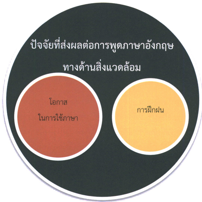
แผนภาพที่ 3 แสดงปัจจัยที่ส่งผลต่อการพูดภาษาอังกฤษทางด้านสิ่งแวดล้อม

กฎการเรียนรู้ตามทฤษฎีเชื่อมโยงของธอร์นไดค์ (Law of Learning in Thorndike Theory) จากการศึกษาทฤษฎีการเรียนรู้ตามทฤษฎีเชื่อมโยงของธอร์นไดค์ พบว่า ประกอบด้วย 3 ข้อ ดังนี้