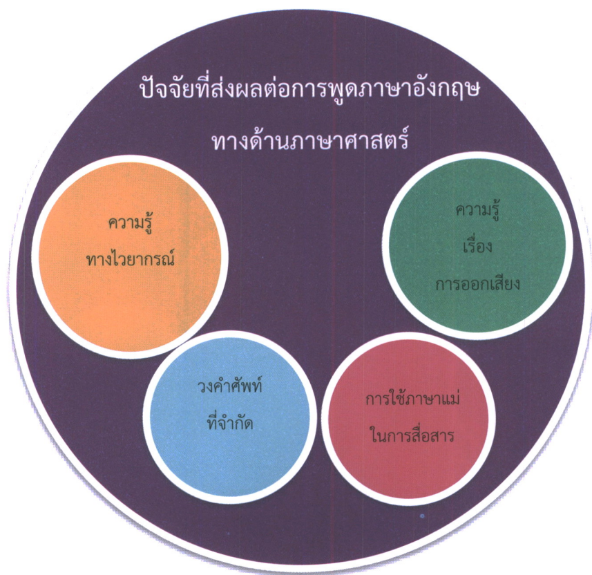
แผนภาพที่ 2 แสดงปัจจัยที่ส่งผลต่อการพูดภาษาอังกฤษทางด้านภาษาศาสตร์

3. ด้านสิ่งแวดล้อม พบว่า ผู้เรียนขาดการฝึกฝนและโอกาสในการใช้ภาษาในการสื่อสารในชีวิตประจำวัน และสิ่งแวดล้อมไม่เอื้ออำนวยต่อการฝึกฝนภาษา สิ่งแวดล้อมมีผลต่อการพัฒนาของผู้เรียนภาษา ผู้เรียนภาษาบางคนมีสิ่งแวดล้อมในการใช้ภาษาในชีวิตประจำวัน และสื่อสารกับผู้คนในพื้นที่ของเขาเอง แต่บางคนไม่มีสิ่งแวดล้อมที่เอื้ออำนวยแบบนั้น การสร้างสิ่งแวดล้อมจึงสำคัญต่อผู้เรียน การสร้างสิ่งแวดล้อมในที่นี้ผู้เขียนหมายถึง การตั้งสังคมทางภาษาเป็นสิ่งสำคัญในการเรียนภาษาที่สองและภาษาต่างชาติ เพราะบทบาททางสังคมหรือการตั้งสังคมทางภาษาจะสร้างโอกาสให้ผู้เรียนได้ฝึกใช้ภาษาในชีวิตประจำวัน ในหลายประเทศที่พูดภาษาอังกฤษเป็นภาษาที่สองหรือภาษาต่างชาติ พบว่า ผู้เรียนมีอุปสรรคในการพูดภาษาอังกฤษเพราะพวกเขาไม่ได้ใช้ภาษาในการสื่อสารนอกห้องเรียน และยังมีการศึกษาการพูดภาษาอังกฤษของนักศึกษาในประเทศอาหรับพบว่า ไม่เพียงแค่นักศึกษาในประเทศอาหรับเท่านั้นที่มีประสบการณ์ที่จำกัดในการพูดภาษาอังกฤษ แต่ในประเทศอาเซียนอย่างประเทศเวียดนาม ประเทศญี่ปุ่น ประเทศอินโดนีเซีย และประเทศจีน ผู้เรียนมีอุปสรรคในการสื่อสารภาษาอังกฤษเนื่องจากขาดโอกาสในการใช้ภาษาในห้องเรียน