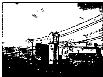
ภาพที่ 5 หอนาฬิกา (เก่า) เชียงราย

หอนาฬิกาเมืองเชียงราย สร้างขึ้นในปี พ.ศ.2510 บริเวณสี่แยกประตูห้วย เดิมมีรูปทรงสี่เหลี่ยมรองรับด้วยเสาสี่เสา ในปี พ.ศ. 2548 เทศบาลนครเชียงราย มีโครงการสร้างหอนาฬิกาเฉลิมพระเกียรติ สมเด็จพระนางเจ้าพระบรมราชินี 12 สิงหาคม 2548 ออกแบบควบคุมการก่อสร้างโดยอาจารย์เฉลิมชัย โฆษิตพิพัฒน์ ศิลปินแห่งชาติ