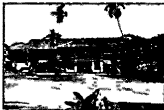
ภาพที่ 7 อาคารแม่กกวิลล่า ในอดีตเป็นที่ตั้งของโรงเรียนดรุณศึกษา

อาคารแม่กกวิลล่า ในอดีตเป็นที่ตั้งของบ้านพระยาภักดีราชกิจ (ตื้อ ภักดี) ครอบครัวคริสตเตียนที่สำคัญของจังหวัดเชียงราย ที่ดินดังกล่าวเคยเป็นส่วนหนึ่งของคุ้มหลวงในสมัยเจ้าหลวงสุริยะ