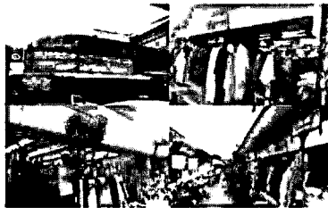
ภาพที่ 8 ย่านขายผ้าชุมชนอินเดีย บนถนนเตมีย์

กลุ่มคนชาวอินเดีย อาศัยอยู่ในบริเวณถนนไตรรัตน์ภายในซอยเตมีย์ รวมกลุ่มในรูปแบบเครือข่าย 5 นามสกุล ได้แก่ อุปรา โซนี่ พล วเซ โกเชอ ชาวอินเดีย ในอดีตในชุมชนเคยมีวัดอินเดียขนาดเล็ก ภายหลังสร้างวัดแห่งใหม่ ณ ตำบลเวียง อำเภอเมืองเชียงราย เชียงราย เรียกกันว่า วัดพระแม่อุมาเทวี (Upra, 2017)