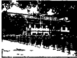
ภาพที่ 4 อาคารศรีวิทยา ได้รับรางวัลอนุรักษ์ศิลปกรรมสถาปัตยกรรมดีเด่นปี พ.ศ.2553