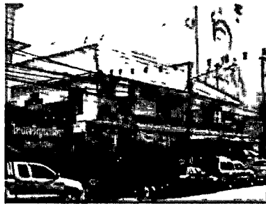
ภาพที่ 6 ร้านฮิมกี จำหน่ายวัสดุก่อสร้างแห่งแรกย่านตัวเมืองเชียงราย

ร้านฮิมกี สร้างขึ้นใน พ.ศ. 2480 ที่อยู่อาศัยและร้านจำหน่ายวัสดุก่อสร้างของครอบครัวนายฮิม องค์กรสุวรรณ นายช่างคนสำคัญของเมืองเชียงราย ผลงานการก่อสร้าง ได้แก่ ตึกแบล็คเทล โรงเรียนเชียงรายวิทยาคม โบสถ์คริสต์จักรที่ 1 เวียงเชียงราย ตึกอำนวยการโรงพยาบาลเชียงรายประชานุเคราะห์ และร้านฮิมกี ถือได้ว่าเป็นบุคคลสำคัญในท้องถิ่น และเป็นอาคารโบราณที่ทรงคุณค่าของเมือง (Wongwanthane, 2016)