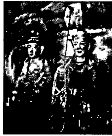
ภาพที่ 1 รูปปั้นเจ้าพ่อและเจ้าแม่ดอยจอมทอง