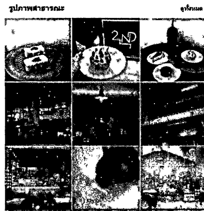
ภาพที่ 3 แสดงรูปภาพที่โพสต์โดยผู้ใช้งานสื่อสังคมออนไลน์เฟซบุ๊กที่อยู่ในแฮชแท็ก #cafehoppingth