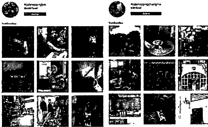
ภาพที่ 4 แสดงเปรียบเทียบรูปภาพที่โพสต์โดยผู้ใช้งานสื่อสังคมออนไลน์อินสตาแกรมระหว่างกลุ่มคาเฟ่ฮอปปีงในกรุงเทพฯ ที่ติดแฮชแท็ก #cafehoppingbkk กับกลุ่มคาเฟ่ฮอปปีงในต่างจังหวัดที่ติดแฮชแท็ก #cafehoppingchiangmai

เท่านั้น แต่ยังมีร้านที่มีบรรยากาศภายนอกร้าน เช่น โรชา ทุ่งนา ที่มีความสวยงามและถูกนำเสนอผ่านภาพถ่าย รวมทั้งบางส่วนได้นำจุดเด่นของอาหารประจำจังหวัดนั้น ๆ มานำเสนอเช่นกัน ดังตัวอย่างจากภาพที่ 4