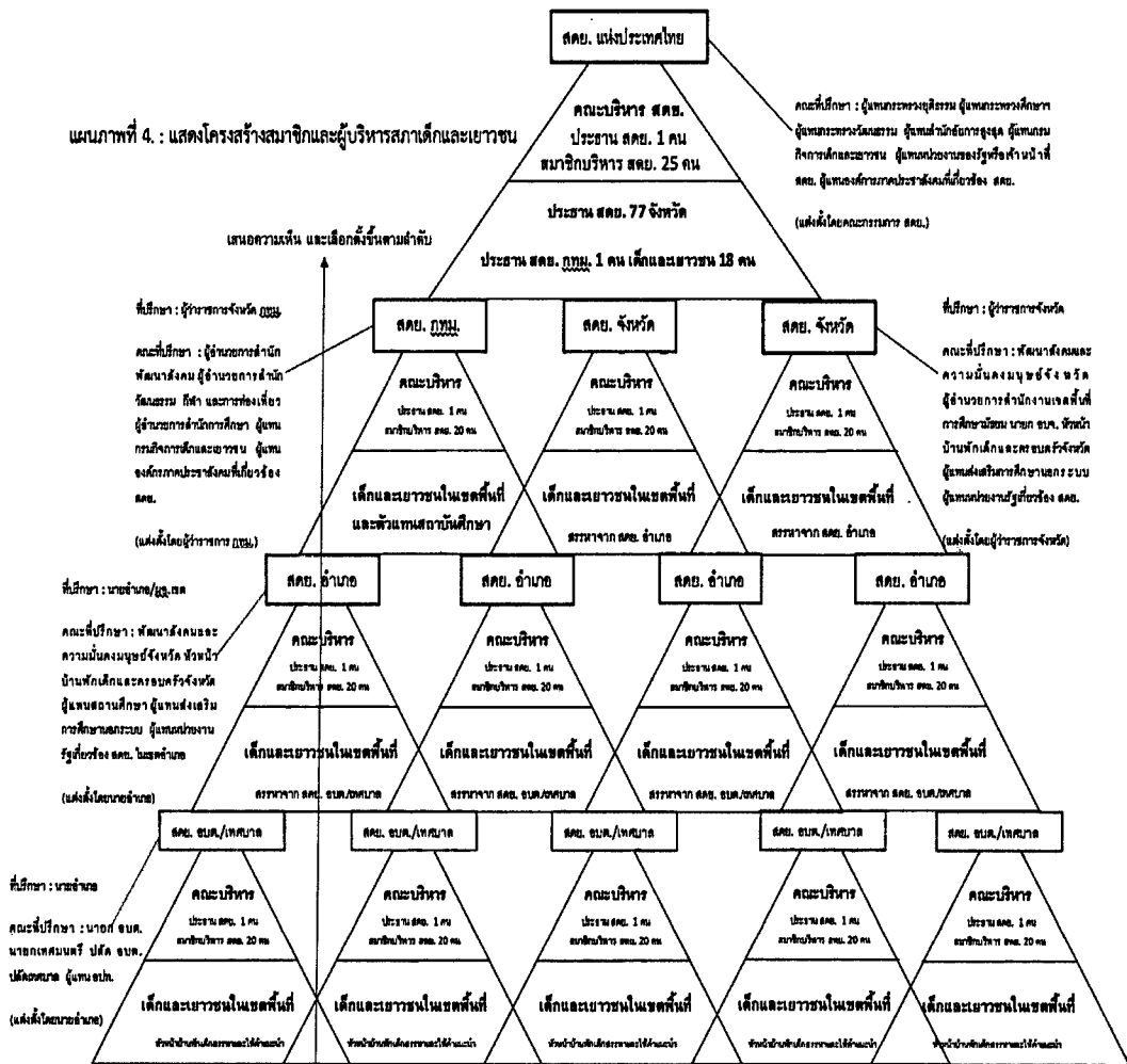
แผนภาพที่ 3 : แสดงโครงสร้างสมาชิกและผู้บริหารสภาเด็กและเยาวชน ตามส่วนที่ 1 สภาเด็กและเยาวชน พ.ร.บ. ส่งเสริมการพัฒนาเด็กและเยาวชนแห่งชาติ พ.ศ. 2560 (ฉบับที่ 2)