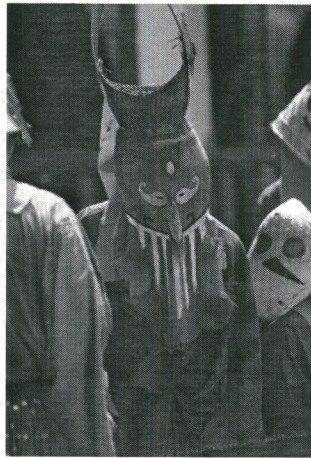
ภาพที่ 3 ผีตาโขนน้อยในการละเล่นผีตาโขน พ.ศ. 2563

ชาวอำเภอด่านซ้าย ซึ่งเป็นคนในท้องถิ่นโดยแท้ โดยก่อนเล่นจะต้องมีการเตรียมเครื่องแต่งกายผีตาโขน ได้แก่ หน้ากากผีตาโขน และชุดผีตาโขน โดยเฉพาะหน้ากากผีตาโขนนั้นต้องใช้เวลาประดิษฐ์ประดอยประมาณ 15 วัน โดยทำจากหวดหนึ่งข้าวเหนียวที่ใช้แล้วหงายทำเป็นหัวส่วนบน เย็บเข้ากับโคนกาบทางมะพร้าวแห้งเป็นส่วนของหน้า และตกแต่งตา ปากด้วยสีต่าง ๆ ที่ไม่ฉูดฉาด (กฤษฎาภรณ์ อุ่นไพร, การสื่อสารส่วนบุคคล, 30 มิถุนายน 2563) ซึ่งการทำหน้ากากผีตาโขนน้อยในปีนี้ ส่วนใหญ่คนที่เล่นผีตาโขนจะทำเอง มีการรวมกลุ่มทำ โดยที่ไม่มีการเช่าหรือซื้อ เนื่องจากในงานไม่มีการประกวดหน้ากากผีตาโขนเช่นปีที่ผ่านมา การทำหน้ากากผีตาโขนน้อย รวมถึงการจัดเตรียมเครื่องแต่งกายจึงเป็นไปด้วยความเรียบง่าย ซึ่งเป็นเครื่องแต่งกายแบบดั้งเดิม ฉะนั้น การละเล่นผีตาโขนน้อยภายใต้มาตรการเฝ้าระวังป้องกันและควบคุมการแพร่ระบาดของโรคโควิด-19 ทำให้ชาวบ้านได้หวนจัดเตรียมเครื่องแต่งกายผีตาโขนน้อยแบบดั้งเดิม โดยที่สามารถทำได้ทุกวัย แม้แต่เด็กก็สามารถทำได้ เนื่องจากไม่ได้คำนึงถึงความสวยงามมากนัก ซึ่งจะแตกต่างจากการทำเครื่องแต่งกายผีตาโขนน้อยที่ผ่านมาที่ผู้ทำจะต้องเป็นช่างที่มีฝีมือเท่านั้น การกระทำเช่นนี้ถือว่าการอนุรักษ์และสืบทอดเครื่องแต่งกายผีตาโขนน้อยแบบดั้งเดิมให้คงอยู่และให้คนรุ่นหลังได้เห็นต่อไป