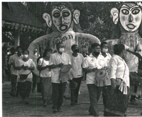
ภาพที่ 2 การแห่พิตาโชน พ.ศ. 2563

แม้ว่าความสนุกเพลิดเพลินของงานประเพณีบุญหลวงและการละเล่นพิตาโชน อำเภอด่านซ้าย จังหวัดเลย พ.ศ. 2563 จะเกิดในการเล่นพิตาโชนเพียงกิจกรรมเดียว แต่ในปีนี้มีสิ่งที่ทำให้กำลังใจคนในท้องถิ่น และผู้พบเห็นเพิ่มขึ้น นั่นก็คือ ข้อความ “สู้โควิด 19” ที่ช่างได้ตกแต่งเขียนลงบนตัวพิตาโชนใหญ่ชาย อันเกิดจากการสร้างสรรค์ของช่างที่นำวิกฤติการณ์ที่เกิดขึ้นในปัจจุบันมาบูรณาการกับวิธีการตกแต่งที่เคยทำมาก่อน ซึ่งมีการแห่ตั้งแต่บ้านเจ้าพ่อกวนจนถึงวัดโพนชัย ถือว่าเป็นข้อความที่ทำให้กำลังใจผู้คนที่ในสถานการณ์การแพร่ระบาดของโรคโควิด-19 ดังนั้น ประเพณีบุญหลวงและการละเล่นพิตาโชน พ.ศ. 2563 ที่จัดภายใต้สถานการณ์โรคโควิด-19 ทำให้ช่างได้ปรับวิธีการตกแต่งชุดพิตาโชนใหญ่ไปตามเป็นวิกฤติการณ์ที่เกิดขึ้น ทำให้งานในปีนี้มีบทบาทหน้าที่เพิ่มขึ้น คือ มีหน้าที่ในการให้กำลังใจคนในท้องถิ่นตามสถานการณ์บ้านเมืองที่คนในท้องถิ่นกำลังเผชิญอยู่