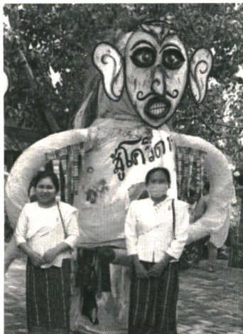
ภาพที่ 4 ผีตาโชนใหญ่ชายในการละเล่น ผีตาโชน พ.ศ. 2563

ช่วงต้นการทำเครื่องแต่งกายผีตาโชนน้อยและผีตาโชนใหญ่ในประเพณีบุญหลวงและการละเล่น ผีตาโชน พ.ศ. 2563 ทำให้คนในท้องถิ่นอำเภอด่านซ้ายได้เรียนรู้การทำเครื่องแต่งกายผีตาโชนแบบดั้งเดิม ซึ่งใน การทำเครื่องแต่งกายผีตาโชนน้อย ทุกคนสามารถมีส่วนร่วมในการทำได้แม้กระทั่งเด็ก เนื่องจากไม่มีข้อจำกัดหรือ ต้องคำนึงถึงความสวยงามประณีตดังเช่นปีที่ผ่านมา ส่วนผีตาโชนใหญ่แม้จะมีข้อจำกัดในการทำที่ต้องเป็นคน ในตระกูลทำ ซึ่งเป็นการเรียนรู้จากลูกหลานในตระกูลรุ่นสู่รุ่น จะเห็นได้ว่าภายใต้ข้อจำกัดในการจัดงานประเพณี บุญหลวงและการละเล่นผีตาโชนในสถานการณ์โรคโควิด-19 มีบทบาทหน้าที่สืบทอดและให้การศึกษาการทำ เครื่องแต่งกายผีตาโชนกับคนรุ่นหลังเพิ่มมากขึ้น