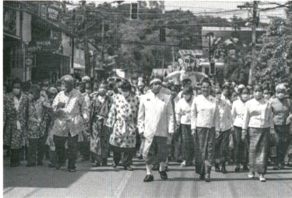
ภาพที่ 1 ขบวนเจ้าพ่อกวน พ.ศ. 2563

ร่วมกันอย่างปลอดภัย จากการจัดงานประเพณีบุญหลวงและการละเล่นผีตาโขนในภาวะสถานการณ์โรคโควิด-19 สะท้อนให้เห็นการยอมรับแบบแผนแนวปฏิบัติของสังคม ด้านเจ้าพ่อกวนและชาวบ้าน มีการยอมรับและได้ปฏิบัติตามมาตรการควบคุมโรค สวมหน้ากากผ้าหรือหน้ากากอนามัยขณะประกอบพิธีหรือทำกิจกรรมต่าง ๆ นอกจากนี้ภาครัฐก็ยินยอมให้เจ้าพ่อกวนกำหนดวันจัดงานดังเช่นที่เคยปฏิบัติมาทุกปี ทั้งนี้เพื่อที่จะสืบสานและรักษาประเพณีบุญหลวงและการละเล่นผีตาโขน ซึ่งถือเป็นประเพณีเก่าแก่คู่กับอำเภอด่านซ้ายให้คงอยู่สืบไป