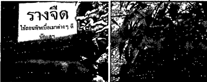
ภาพที่ 4 อุษา กลมพันธ์. (2562, ตุลาคม 18). รางจืด[ถ่ายภาพ]

มีสรรพคุณช่วยรักษาพิษไข้ แก้อ่อนใน บำรุงกำลัง ฆ่าพยาธิในท้อง