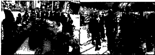
ภาพที่ 1 ภูเขา กลมพันธ์. (2556, พฤษภาคม 24). พิธีกรรมรำผีสะเอง[ถ่ายภาพ]

วิถีวัฒนธรรมที่เป็นศูนย์รวมจิตใจของกลุ่มชาติพันธุ์เยอ คือ การเคารพไหว้ผีบรรพบุรุษของตน และมีหมอเมืองเป็นผู้คอยดูแลลูกบ้านในชุมชน ชาวเยอมีความเชื่อในเรื่องของความเจ็บป่วยว่าเป็นการกระทำของภูตผีและวิญญาณ จึงต้องประกอบพิธีกรรมเช่นผี และมีการรำผีสะเอง เพื่อสร้างความพึงพอใจให้ภูตผี ผู้ประกอบพิธีเรียกว่าผีมือ ซึ่งทุกหน้าที่เป็นร่างทรง เครื่องดนตรีที่ใช้ประกอบในพิธีกรรม คือ แคน ผู้ชายมีหน้าที่เป่าแคน ผู้หญิงมีหน้าที่ในการเช่น บวงสรวง เครื่องเช่น บวงสรวง ได้แก่ ดอกไม้ รูปเทียน และเหล้า เป็นต้น การประกอบพิธีรำผีสะเองนั้น จะรำเป็นวงกลมต่อเนื่องกัน