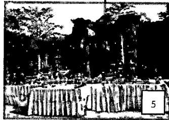
ภาพที่ 4 การจัดเวทีพิธีเปิดงาน เยี่ยมเยือนตาเมื่อน มีประกวดการแต่งกายผ้าไหม ภาพที่ 5 แสดงการวางบายศรี โต๊ะเครื่องเช่นบวงสรวงที่หน้าปราสาทตาเมื่อนธม