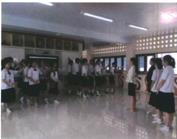
ภาพที่ 5 ภาพกิจกรรมในการเรียนการสอน

8. ครูผู้สอนแบ่งกลุ่มนักเรียน โดยคัดเลือกนักเรียนที่ปฏิบัติทำได้ดีและถูกต้องตามจังหวะเพลง รับหน้าที่เป็นหัวหน้ากลุ่ม และแบ่งออกเป็นหลาย ๆ กลุ่ม