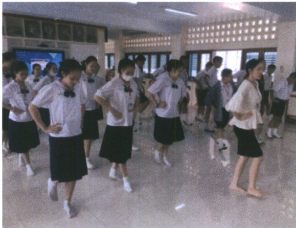
ภาพที่ 3 ภาพกิจกรรมในการเรียนการสอน

5. ครูอธิบายและสาธิตการก้าวเท้า จากนั้นให้นักเรียนปฏิบัติตาม