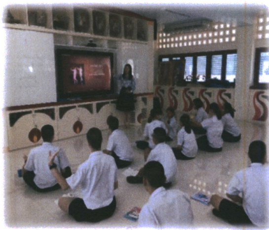
ภาพที่ 8 ภาพกิจกรรมในการเรียนการสอน

1. ให้นักเรียนดูรูปแบบและวิธีการแสดงรำวงมาตรฐานจากสื่อวีดิทัศน์รำวงมาตรฐาน