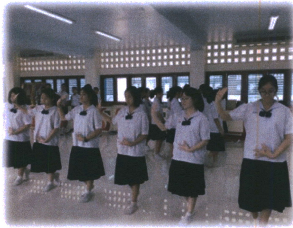
ภาพที่ 10 ภาพกิจกรรมในการเรียนการสอน