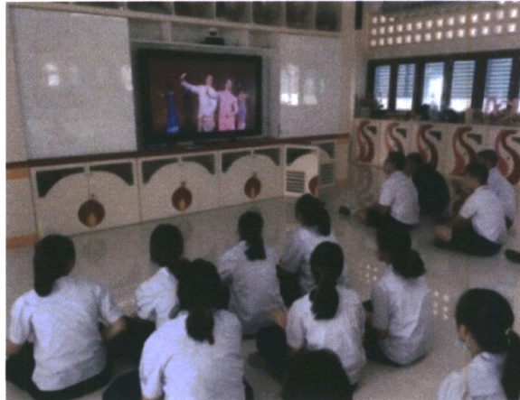
ภาพที่ 1 ภาพกิจกรรมในการเรียนการสอน