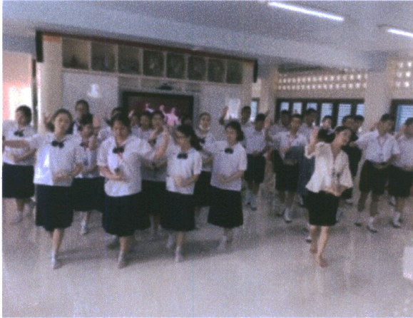
ภาพที่ 2 ภาพกิจกรรมในการเรียนการสอน

5. ครูอธิบายและสาธิตการก้าวเท้า จากนั้นให้นักเรียนปฏิบัติตาม