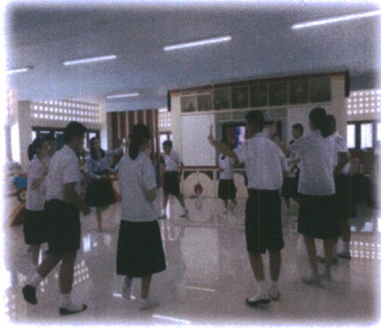
ภาพที่ 9 ภาพกิจกรรมในการเรียนการสอน

2. ให้นักเรียนปฏิบัติร่างมาตรฐานตามรูปแบบและวิธีการแสดง ตามสื่อวีดิทัศน์ ที่ได้ชม