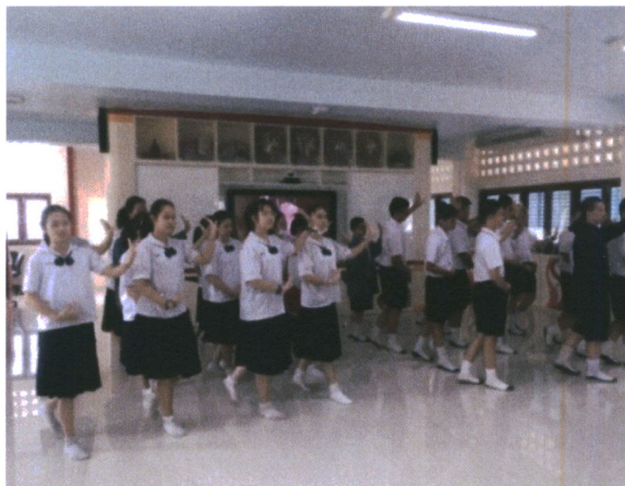
ภาพที่ 4 ภาพกิจกรรมในการเรียนการสอน