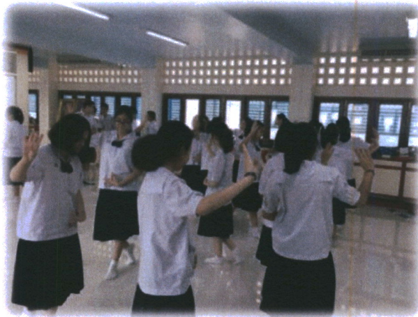
ภาพที่ 11 ภาพกิจกรรมในการเรียนการสอน