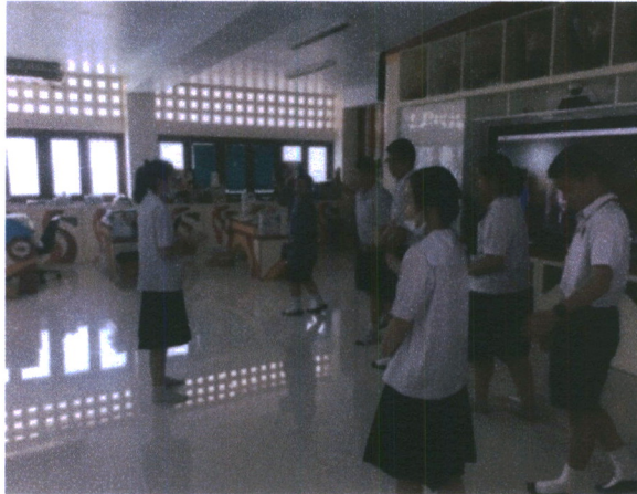
ภาพที่ 6 ภาพกิจกรรมในการเรียนการสอน