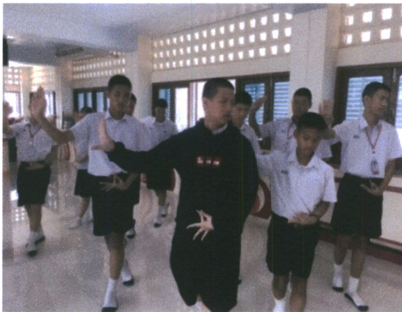
ภาพที่ 7 ภาพกิจกรรมในการเรียนการสอน