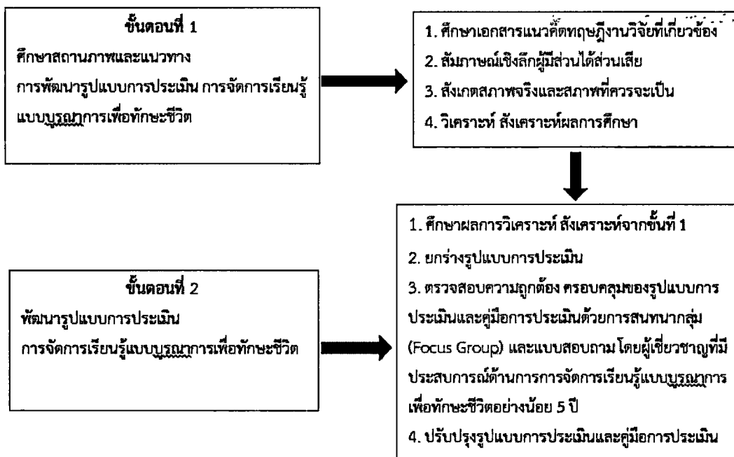
ภาพที่ 1 ขั้นตอนการดำเนินการวิจัย