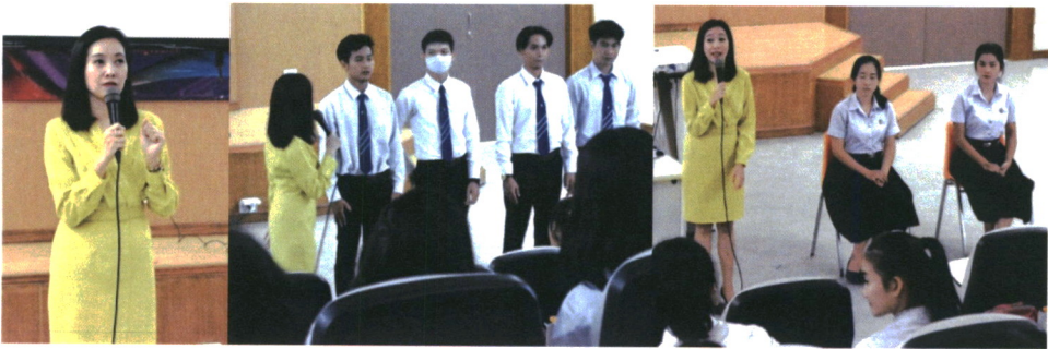
ภาพ 2 บรรยากาศการอบรมเชิงปฏิบัติการ

ผลจากแบบประเมินความพึงพอใจในการอบรมเชิงปฏิบัติการ เรื่อง การพัฒนาทักษะ Soft Skills ด้านบุคลิกภาพและศิลปะการพูดของนักศึกษาครูในศตวรรษที่ 21 สามารถวิเคราะห์ข้อมูลเป็น 2-ตอน ดังนี้