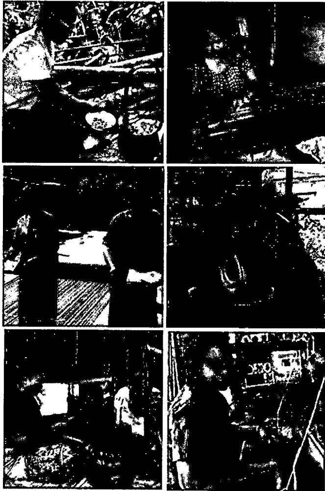
ภาพประกอบ 2 – 7 วิถีชีวิตช่างทอผ้าไหมตำบลสวาย อำเภอมืองสุรินทร์ จังหวัดสุรินทร์

การจัดการท่องเที่ยวของชุมชนผ้าไหมทอมือ ตำบลสวาย เริ่มขึ้นในปี พ.ศ.2560 แนวคิดในการจัดกิจกรรม การท่องเที่ยวเกิดจากความต้องการในการเพิ่มรายได้จากฐานทรัพยากรชุมชน โดยถึงแม้อาชีพหลักของคนในพื้นที่จะเป็นอาชีพเกษตรกรรม แต่กิจกรรมการทอผ้าไหมถือเป็นกิจกรรมหลักที่อยู่ในวิถีชีวิตและเป็นฐานเศรษฐกิจครัวเรือนของคน ในชุมชนที่ทำต่อเนื่องตลอดทั้งปี ที่ผ่านมานักท่องเที่ยวที่เข้ามาเที่ยวในชุมชนส่วนใหญ่เป็นกลุ่มนักท่องเที่ยวที่สนใจ วิถีชีวิตช่างทอ เป็นคณะศึกษาดูงานจากหน่วยงานราชการ องค์กรบริหารส่วนท้องถิ่น นักวิชาการและกลุ่มนักศึกษาที่สนใจกระบวนการทอผ้าไหมและการจัดการวิสาหกิจชุมชนทอผ้า รวมถึงมีกลุ่มนักท่องเที่ยวที่ชื่นชอบ สนใจซื้อผ้าไหมโดยตรงจากช่างทอในชุมชนซึ่งถือเป็นแหล่งผลิตโดยตรง การจัดการท่องเที่ยวของชุมชนผ้าไหมทอมือตำบลสวาย ดำเนินการโดยกระบวนการมีส่วนร่วมของคนในชุมชน ร่วมกันเป็นเจ้าของฐานท่องเที่ยวและร่วมจัดกิจกรรมการท่องเที่ยว มีภาคีเครือข่ายร่วม