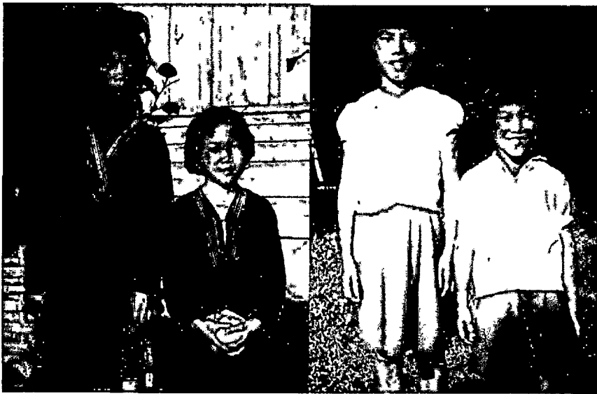
ภาพประกอบ 1 เปรียบเทียบทรงผมและเครื่องแต่งกายในชุดม้งกับชุดนักเรียน อำเภอปัว จังหวัดน่าน ถ่ายปี 2511

กฎระเบียบเกี่ยวกับเครื่องแต่งกาย ก่อนวันโรงเรียนเปิดภาคการศึกษา เด็กนักเรียน โดยเฉพาะผู้หญิง จะต้องเปลี่ยนทรงผมจากทรงเดิมที่เป็นที่นิยมของกลุ่มชาติพันธุ์หรือในท้องถิ่นมาเป็นผมทรงนักเรียนแทน ในวันแรกที่ไปโรงเรียน นักเรียนจะได้รับการเปลี่ยนเสื้อผ้าจากชุดประจำกลุ่มชาติพันธุ์ที่สวมใส่มาตลอดตั้งแต่เล็กมาเป็นชุดนักเรียนตามระเบียบของโรงเรียน ทั้งนี้ ในกรณีของโรงเรียนที่อยู่บนภูเขา หากใครไม่มีชุดนักเรียน อาจได้รับการอนุโลมจากครูเป็นกรณีพิเศษ แต่เขาก็จะกลายเป็นแกะดำในบรรดาเพื่อนร่วมชั้นและโรงเรียน หากเป็นโรงเรียนที่เคร่งครัด พี่น้องในบางครอบครัวต้องสลับกันไปโรงเรียนคนละวัน เพราะมีชุดนักเรียนเพียงชุดเดียว ที่สำคัญคือเด็กต้องรู้จักการใส่ถุงเท้าและรองเท้านักเรียน ทั้งๆ ที่ในชีวิตจริงแล้วเด็กบางคนไม่เคยได้ใส่แม้แต่รองเท้าแตะมาก่อนเลย ดังนั้น ชาวบ้านจึงมีคำเปรียบเปรยว่าการเข้าเป็นนักเรียนใหม่ก็คือก้าวแรกของการ “การแปลงร่าง” ของเด็กชาติพันธุ์ไปเป็นไทยนั่นเอง