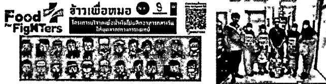
ภาพประกอบ 3 Project Partnerships in Phase 1