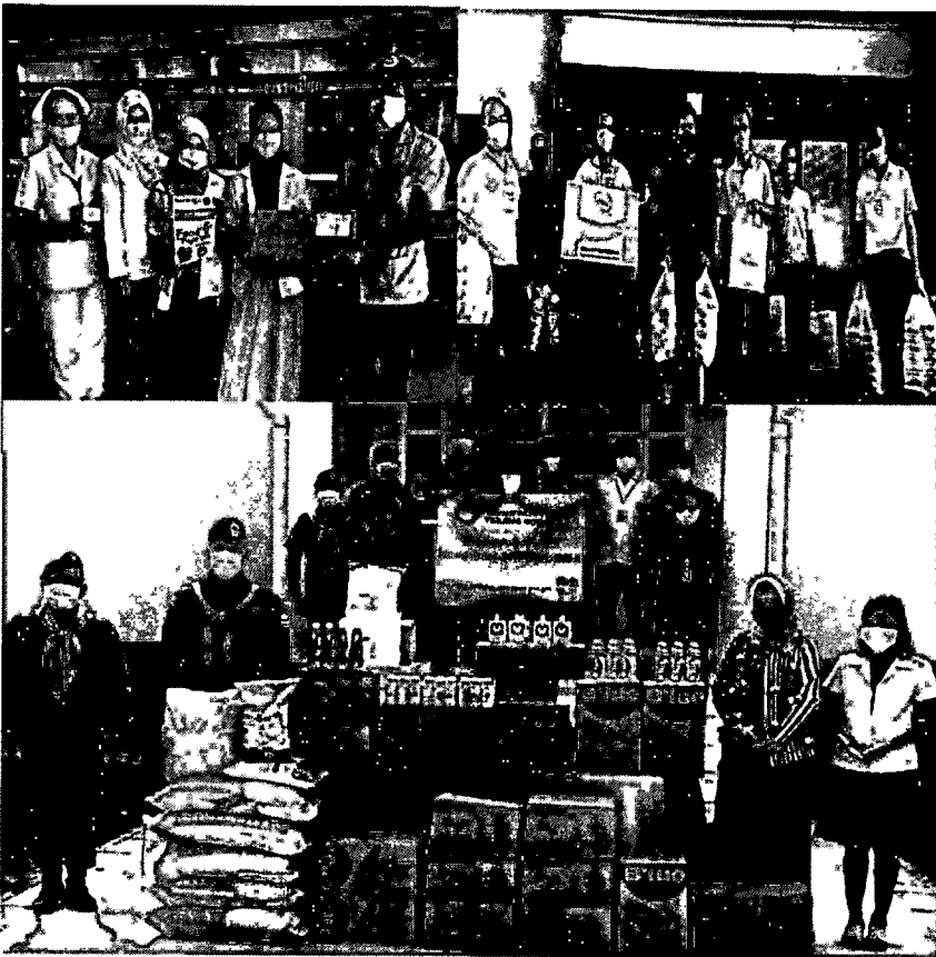
ภาพประกอบ 5 สมาชิกในโครงการ Food For Fighters: ข้าวเพื่อหมอ ขณะส่งมอบอาหารให้แก่บุคลากรทางการแพทย์และเจ้าหน้าที่สาธารณสุขด่านหน้า

โครงการได้จัดอาหารกล่อง อาหารแห้ง ผลไม้ ผัก ฯลฯ ที่ได้รับมานำไปมอบให้กับชุมชนคลองเตย โดยทำงานร่วมกับกลุ่มคลองเตยดีจัง เป็นการดำเนินการที่เมื่อเราได้รับอะไรมาเราจะมาดูว่าเราจะส่งต่อให้กับผู้รับกลุ่มใดจึงจะเกิดประโยชน์เหมาะสมตามวัตถุประสงค์ของการทำงานโครงการเฉพาะกิจเช่นนี้